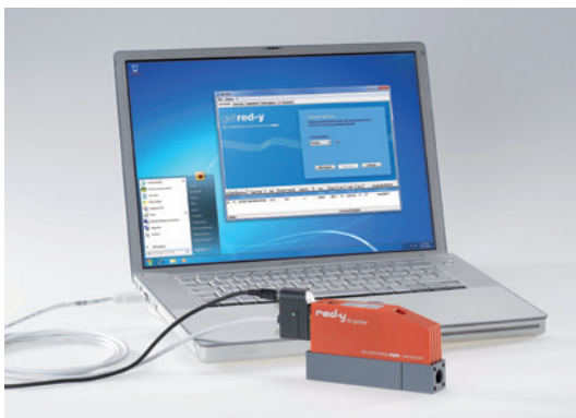
Abb.2 Software get red-y