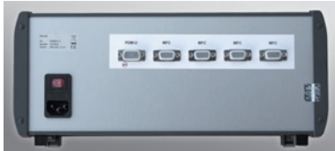
Abb.4 Anschlüsse Rückseite PCU-10 (Art. Nr. 328-3004)

1 Sub-D 9-poliger Stecker für PDM-U Kabel zur Verbindung mit einem PC 1 Sub-D 9-polige Buchse für RS-485C Modbus RTU