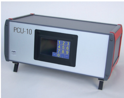
Abb.1 PCU-10 Anzeige- und Steuergerät für die thermischen Massedurchflussmesser und Regler der red-y smart series

Die angeschlossenen red-y smart Messer und Regler werden selbsttätig erkannt und mit Seriennummer, Messbereich und kalibrierter Gasart angezeigt. Es stehen die vier Betriebsarten Einzelinstrumentensteuerung, Gasmischer, Master-Slave Mischer und Brennersteuerung in Englischer Sprache zur Verfügung. Die gespeicherten Werte werden in einem EEPROM Speicher abgelegt, der keine Stützbatterie benötigt. Im Lieferumfang der Tischgehäuse-Version ist die PCU-10 , eine CD mit der get red-y Software, sowie das Netzkabel enthalten. Die Fronttafeleinbau – und die 19"-Einschubvariante werden nur mit CD geliefert, jedoch ohne Kabel.